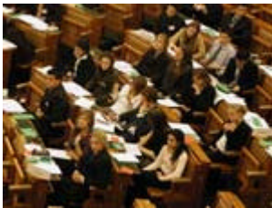
Koncentrerat arbete i parlamentet.