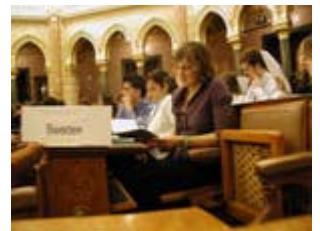
Louise läser på.