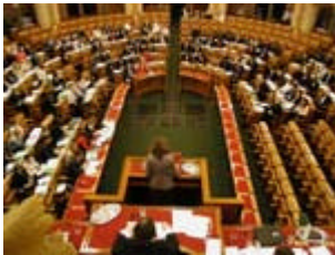
Tal för en resolution.