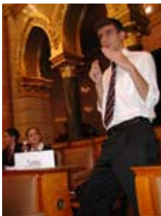
Turkiets inträde i EU blev en het fråga.