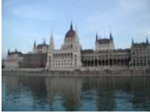
Ungerns parlament är läckert, inte minst från Donau.