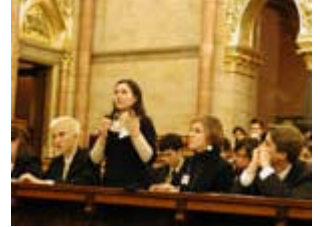
Kommittén som arbetade med Irak-frågan lägger fram sin resolution.

De resolutioner som röstades igenom kommer att skickas till EU-parlamentet, EU-kommissionen och EU:s ministerråd. Sju av resolutionerna i MEP-Budapest röstades igenom och dessa sju kommer alltså att sändas till EU:s olika institutioner.