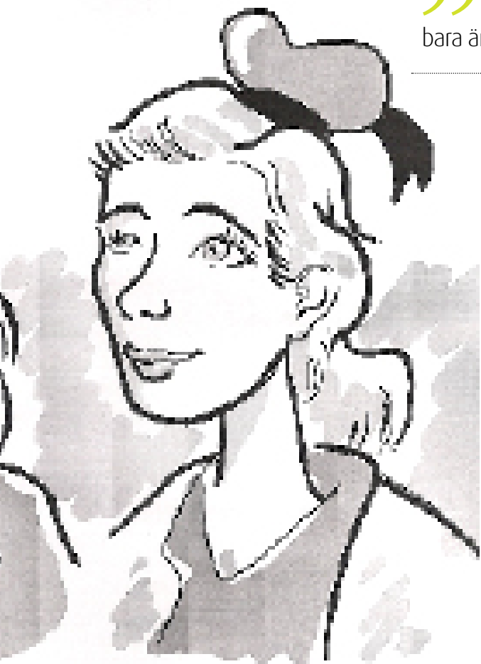
Det är tur att Jimmy tog upp sitt tecknande igen, annars hade reportrarna inte blivit Långben och Kalle Anka.

” Det bästa med festivalen är att det bara är en gång om året.