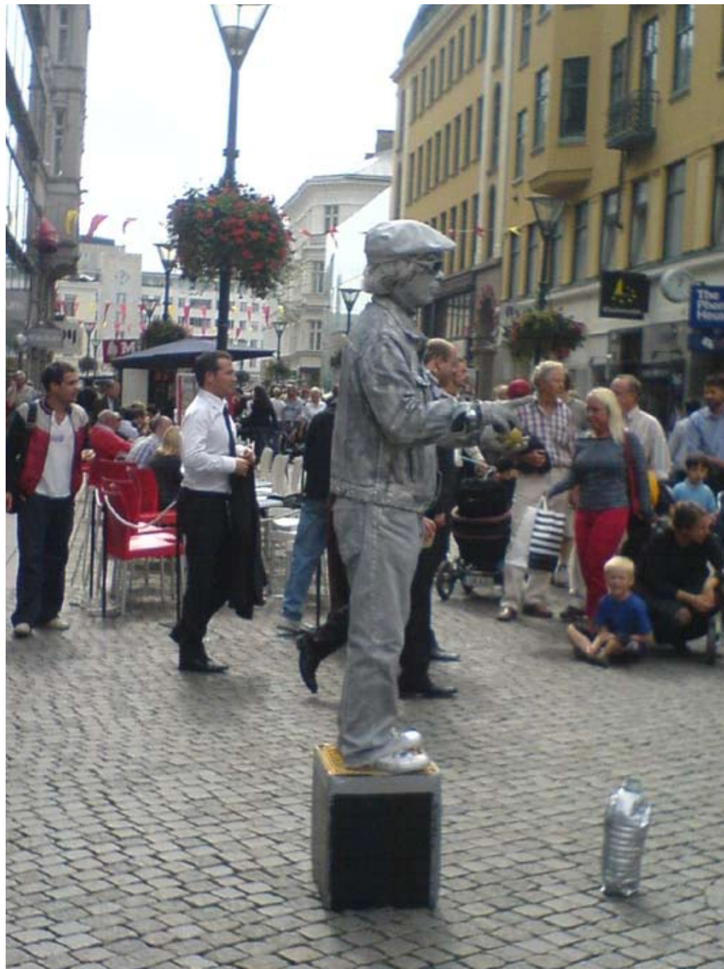
Stålman på festivalen.

Själva biffen till Cevapcicin var bevarad i en kastrull som hölls varm.